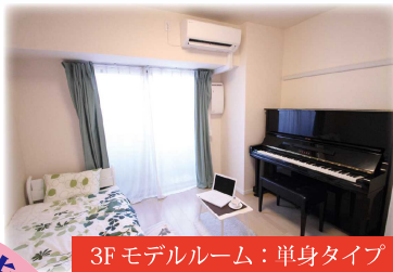
3Fモデルルーム：単身タイプ