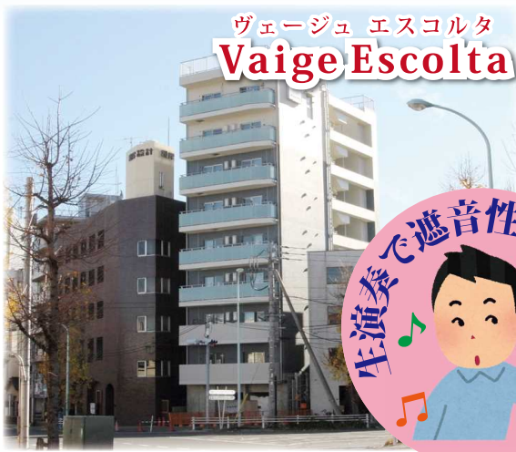
ヴェージュ エスコルタ Vaige Escolta

隣戸からの演奏音が実際にどの程度に感じられるか、「音楽マンション」の遮音性能を音楽家が奏でる生演奏で体感できる見学会を開催します。サロンでのミニ演奏会付きですので、好評な音の響きも体感いただけます。土地活用をご検討の皆さま、ぜひこの機会にご参加ください。