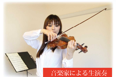
音楽家による生演奏